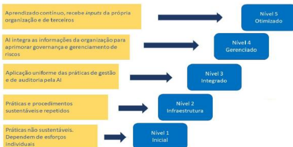
Figura 3 – Níveis de capacidade

Fonte: Adaptado do Relatório de Diagnóstico (IA-CM) de 2020 da Auditoria Interna do Ministério Público da União.