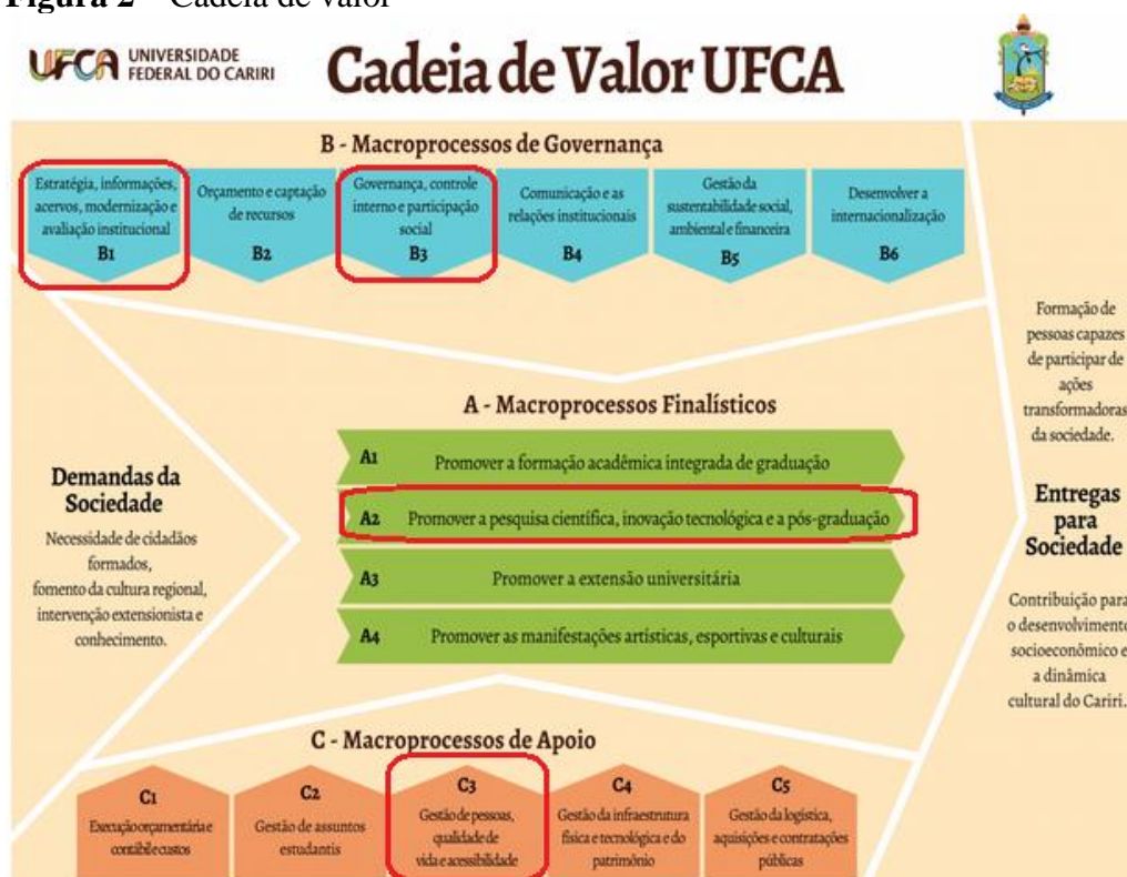
Figura 2 – Cadeia de valor

Além disso, os serviços de auditoria estão diretamente relacionados aos objetivos estratégicos e à cadeia de valor da UFCA.