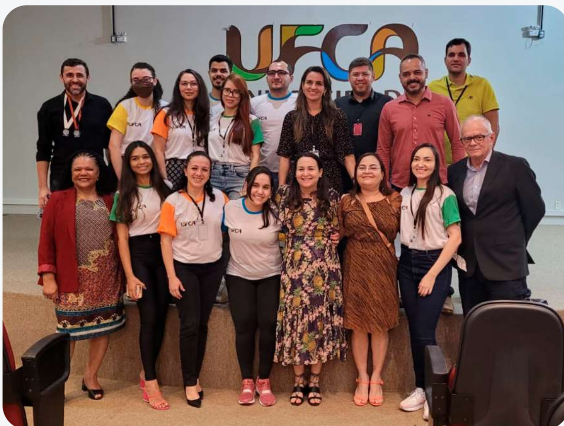
Equipe PRPI após o III Congresso de Pesquisa, Pós-Graduação e Inovação (CONPESQ) 2022.