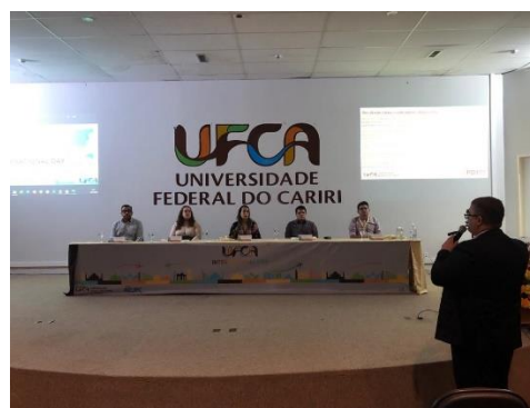
Foto 9. Mesa redonda painel 1 – Ações e Planos de Internacionalização das Unidades Acadêmicas na UFCA.

Logo em seguida, cada um dos representantes das unidades acadêmicas falou sobre as ações indicando exemplos de mobilidade e projetos de internacionalização dos representantes ao longo dos anos.