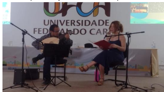
Foto 1. Apresentação Musical do Grupo Musical Ancestrália.

O evento teve início às 9h30 com apresentação musical do Grupo Musical Ancestrália vinculado ao curso de graduação em música da UFCA. Com um repertório de três músicas internacionais.