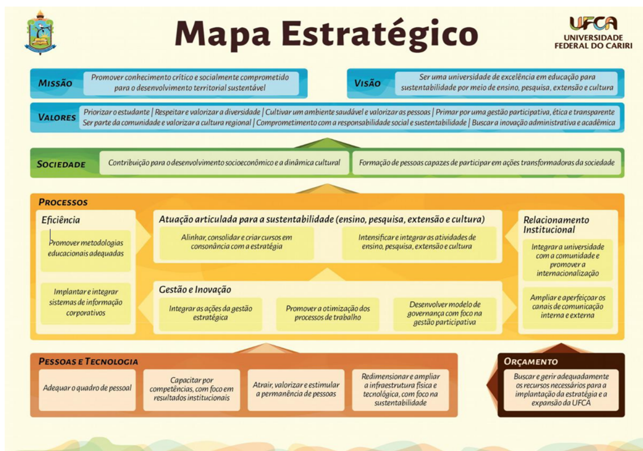
Figura 1 – Mapa Estratégico da UFCA