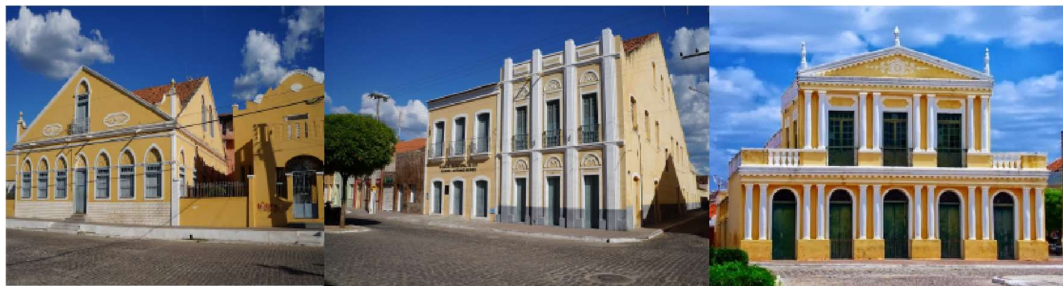
Figura 1: Patrimônio Histórico e Cultural – Icó - CE.

Portanto, o Município polo de apoio presencial do Curso ADS-EAD da UFCA se localiza no Campus da UFCA, na cidade de Icó-Ce. Município que se localiza na Mesorregião Centro Sul e Microrregião Iguatu.