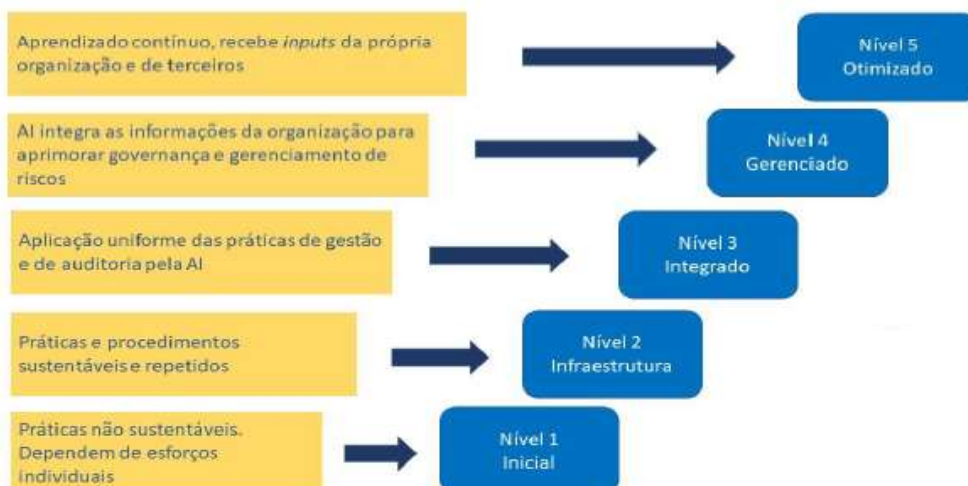
Figura 3 – Níveis de capacidade