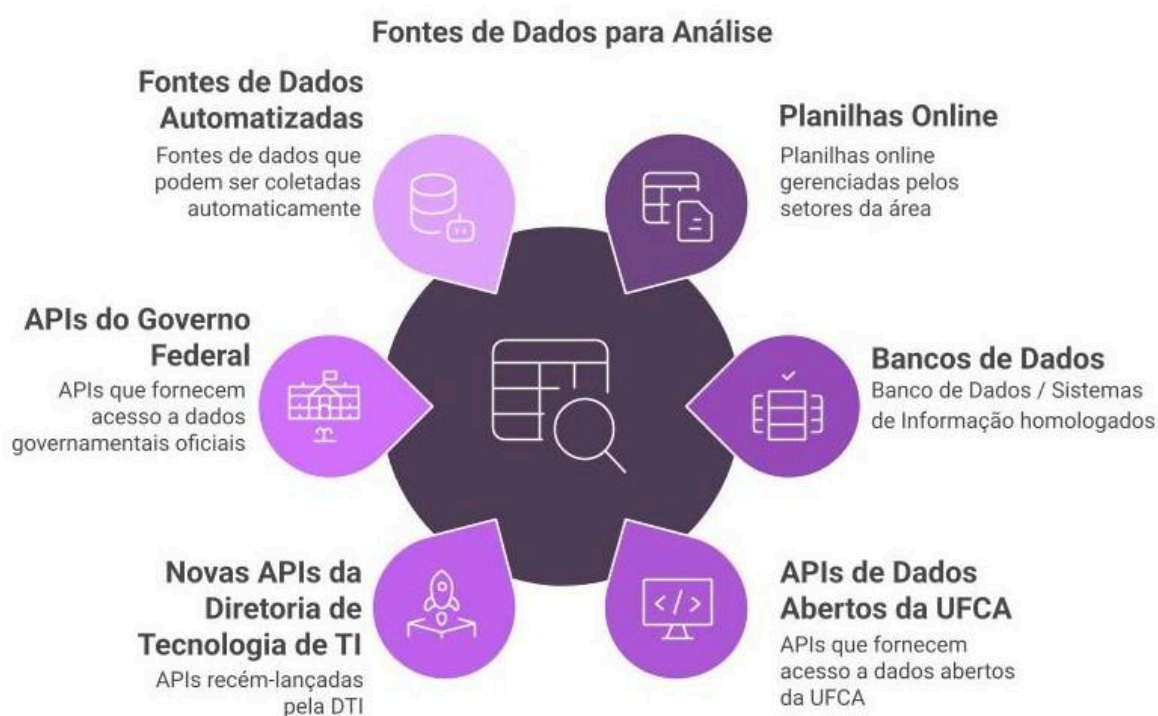
Figura 03 - Fonte de dados durante a catalogação