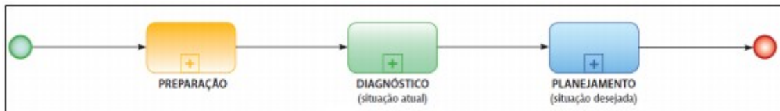
Figura 1: Fases do Processo de Elaboração do PDTI

A construção do PDTI seguiu a metodologia do SISP, conforme estabelecido no Guia de Elaboração do PDTI (MPOG/SLTI, 2012), o qual organiza o processo em três fases: preparação, diagnóstico e planejamento, como ilustrado na figura abaixo.