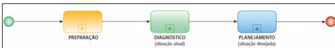
Figura 1: Fases do Processo de Elaboração do PDTI

A construção do PDTI seguiu a metodologia do SISP, conforme estabelecido no Guia de Elaboração do PDTI (MPOG/SLTI, 2012), o qual organiza o processo em três fases: preparação, diagnóstico e planejamento, como ilustrado na figura abaixo.