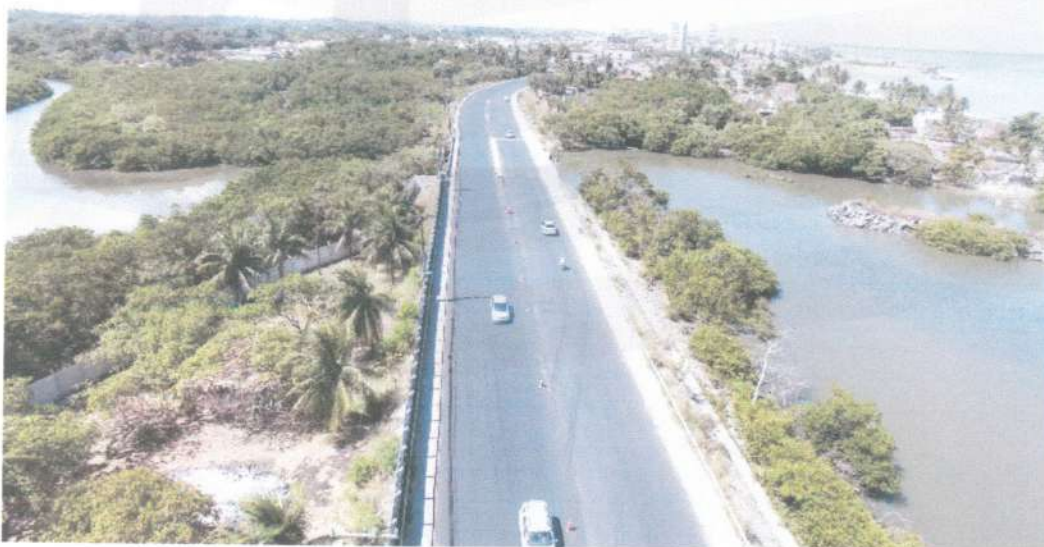
Execução da duplicação da PE-01, inclusive execução da ponte do janga, meio fio e linha d'gua em concreto moldado no local, calçadas e pavimentação asfáltica.