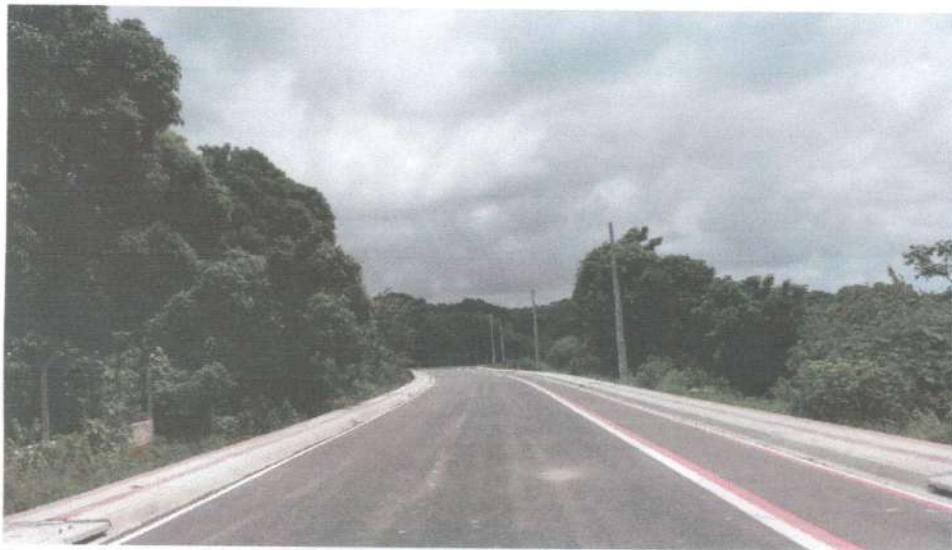
Parte da via transrural executada na UFRPE