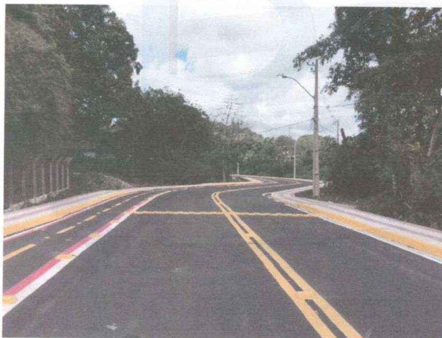
Parte da via transrural executada na UFRPE