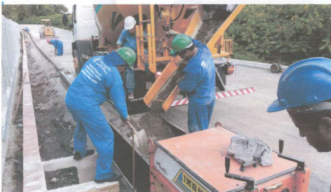
Via: Execução de meio fio e linha d'água de concreto moldada no local com extrusora.