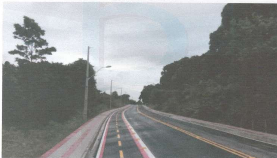
Parte da via transrural executada na UFRPE