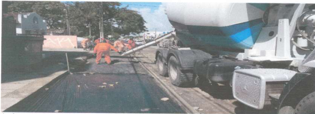
Após meio fio e linha d'gua de concreto moldado no local, execução das calçadas de concreto