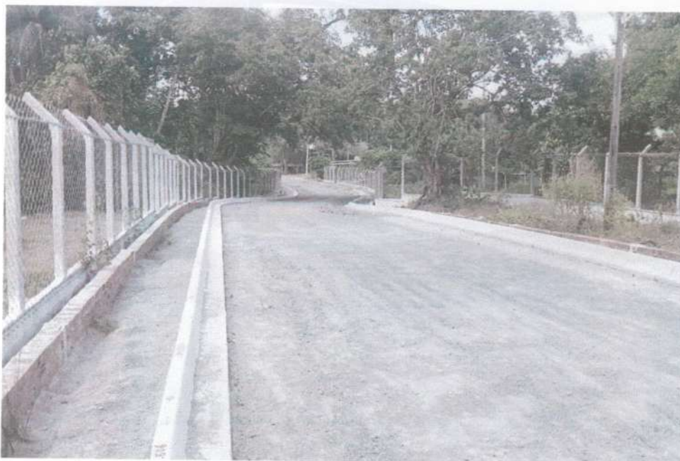
Via com meio fio e linha d'água de concreto moldada in loco com extrusora