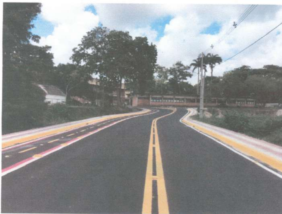
Parte da via transrural executada na UFRPE

Caso a Comissão Permanente de Licitação, deseje diligenciar, pode verificar a referida obra no Site da UFRPE, confirmando a referida obra declarada na CAT, acessar o site abaixo com video: