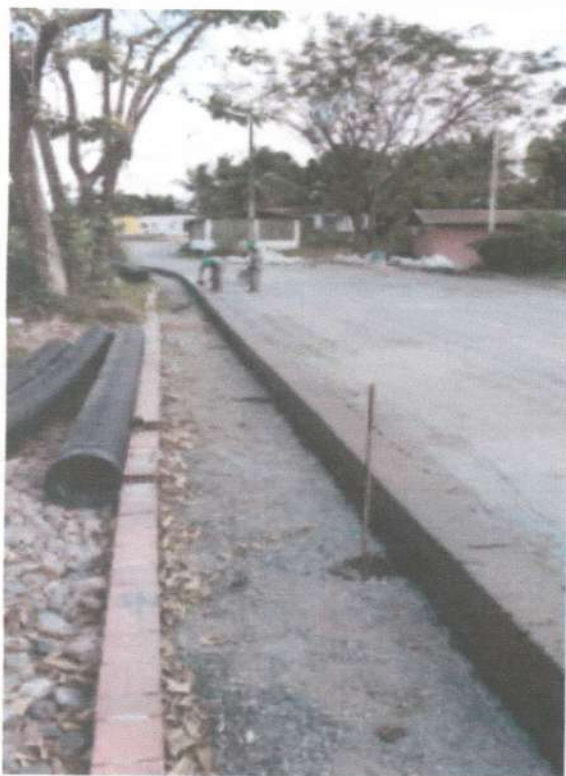
Via Execução de meio fio e linha d'água de concreto moldada no local com extrusora