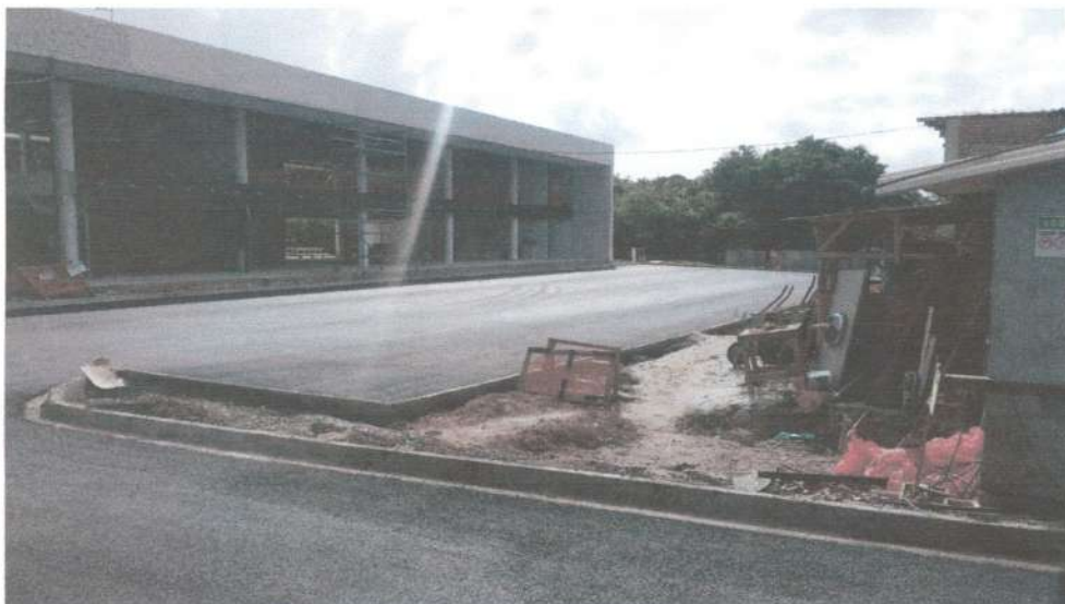
Estacionamento: Execução de meio fio e linha d'água de concreto moldada no local com extrusora