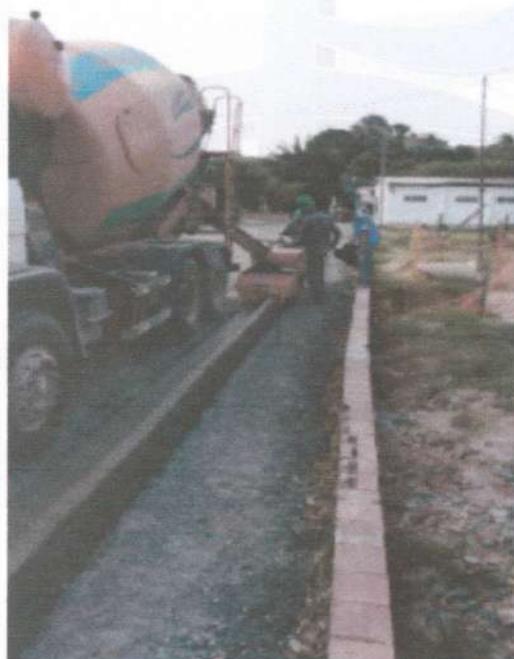
Via: Execução de meio fio e linha d'água de concreto moldada no local com extrusora