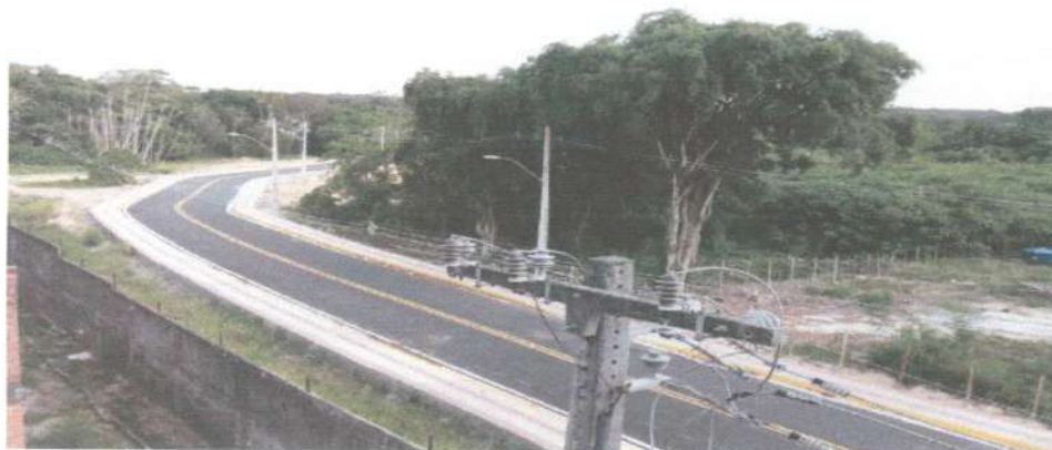
Parte da via transrural executada na UFRPE