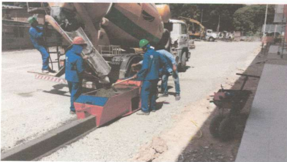
Estacionamento: Execução de meio fio e linha d'agua de concreto moldada no local com extrusora

CAT 2220453568/2017 - 6.378,24m de meio fio de concreto moldado no local;