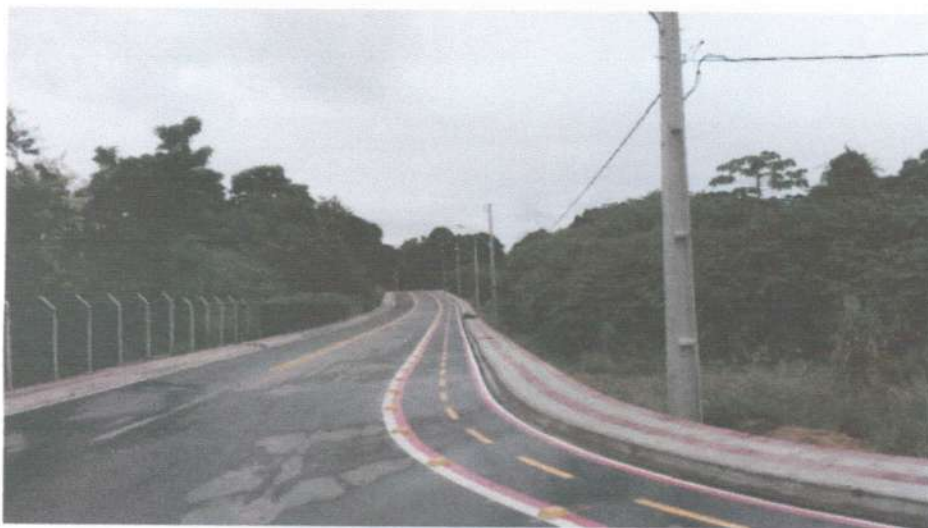
Parte da via transrural executada na UFRPE