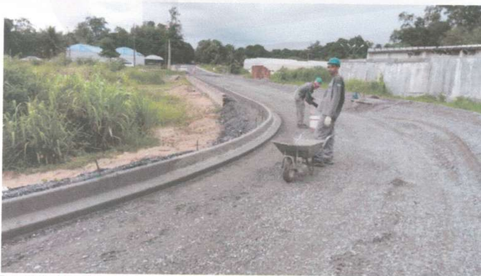
Via: Meio fio e linha d'água de concreto moldada no local com extrusora