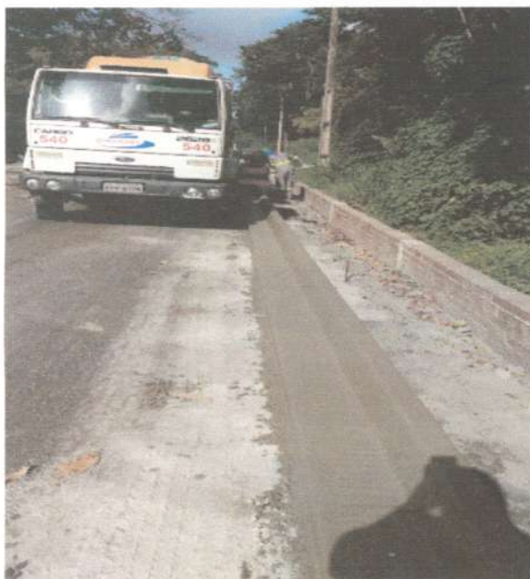
Via: Execução de meio fio e linha d'água de concreto moldada no local com extrusora.