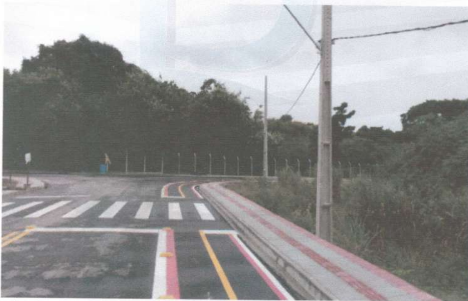
Parte da via transrural executada na UFRPE