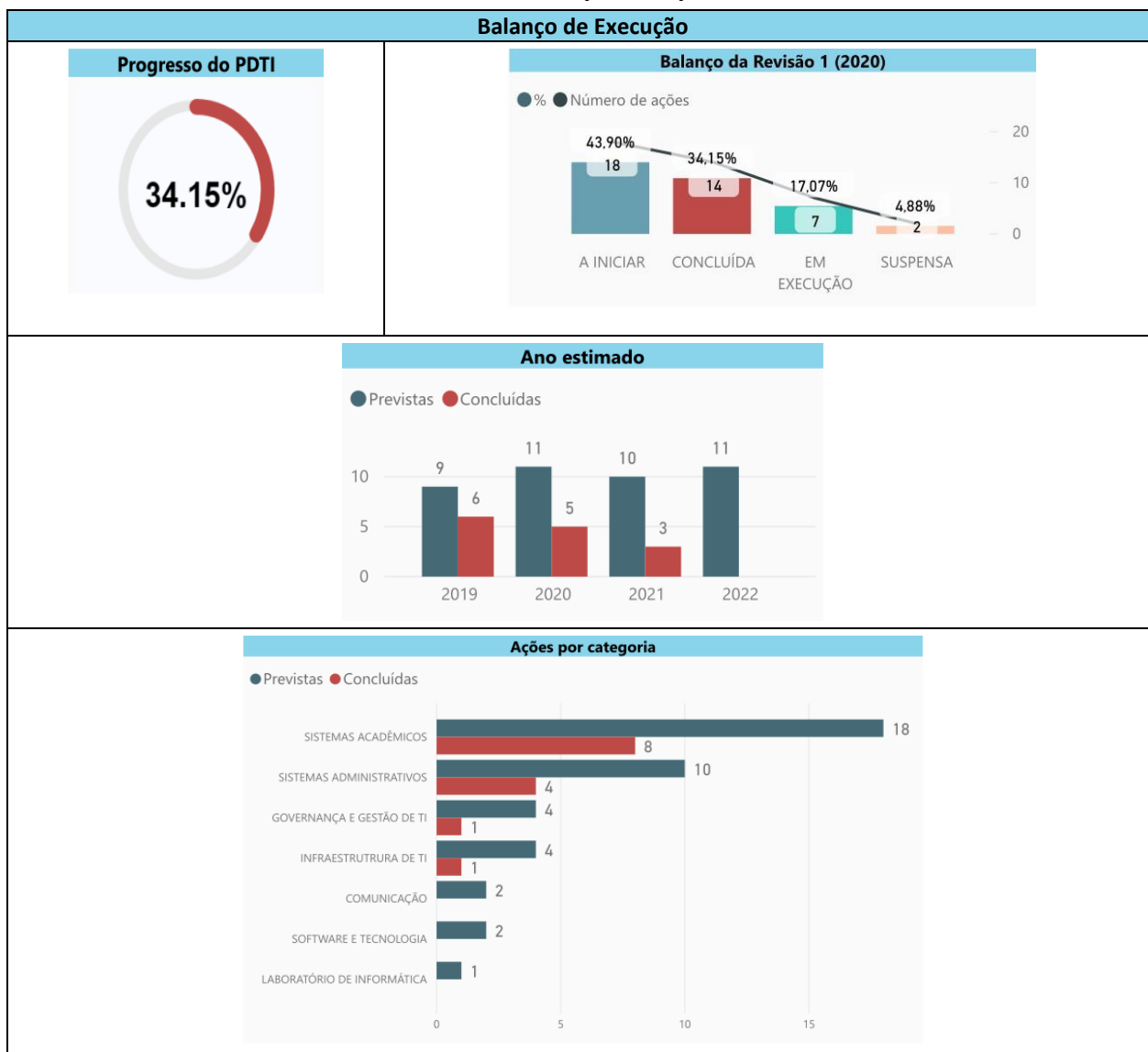
Tabela 4: Ações Concluídas, “em execução”, A iniciar e suspensas.