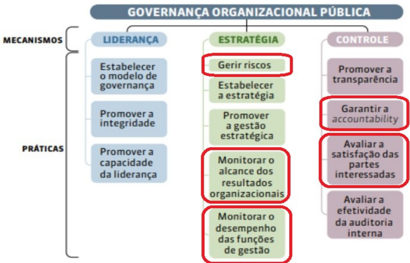
Figura 1 – Governança organizacional pública: mecanismos e práticas